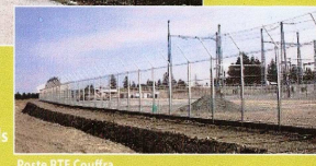
Poste RTE Couffra

Etude et pose de clôtures portails et automatismes